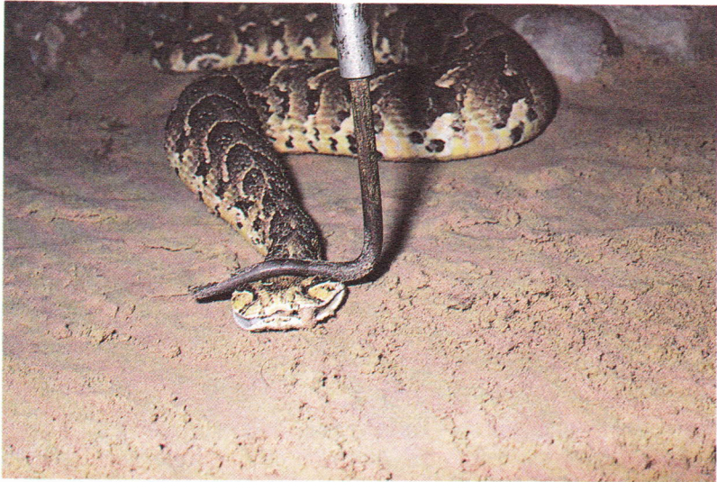
Fig. 1-4. Veilig een gifslang ( Bitis arietans ) oppakken / How to pick up a poisonous snake safely.